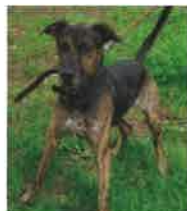
BOUBA né en 2012