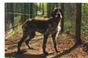
OLKA née en 2011

ILS SONT EN "PANIER RETRAITE", ils ont toujours besoin de parrains et marraines :