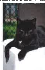
RENAULT 7 ans