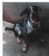
BOBSY né en 2010