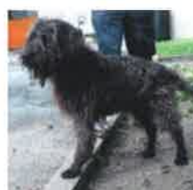
POGBA né en 2007

VOUS LES PARRAINEZ, VOUS LES AVEZ PARRAINÉS... ILS ONT ÉTÉ ADOPTÉS :