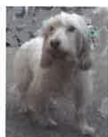
PATI née en 2012

Les chiens : FILOO, HISBROUK, PATI, POGBA, TOCKY et URANUS.