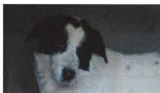
GALAK né en 2011