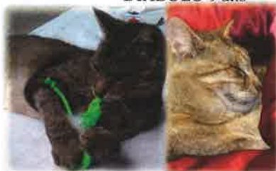
DIABOLO 9 ans