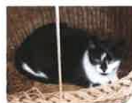
GLINKA 6 ans