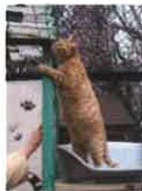
REDBUL 4 ans