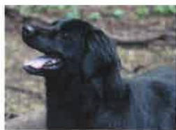
COCA né en 2007

ILS SONT AU REFUGE DEPUIS LONGTEMPS ET ATTENDENT D'ÊTRE ADOPTÉS ou PARRAINÉS :