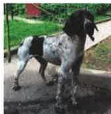
MOUCHOU né en 2011