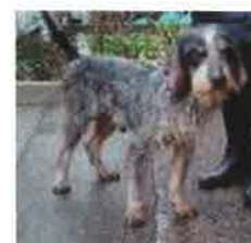
RIFARI né en 2012