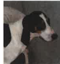
JERRY né en 2013