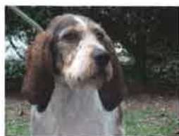
IRWAN né en 2011