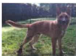
HISBROUK né en 2012