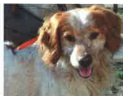
GABUILLE né en 2011