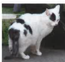
FRAISE 4 ans