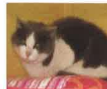
PETRUS 10 ans