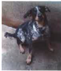
BOBSY né en 2010