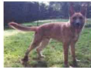
HISBROUK né en 2012