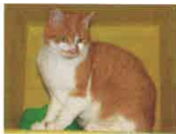
MACAO 4 ans