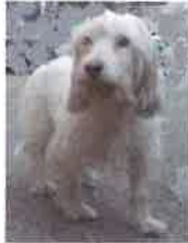
PATI née en 2012