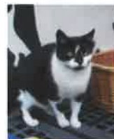
GLINKA 5 ans