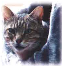
DIABOLO 8 ans