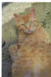
REDBUL 3 ans