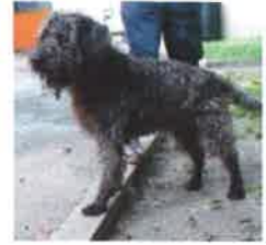
POKBA né en 2007