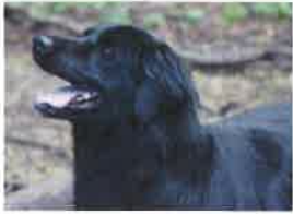
COCA né en 2007

ILS SONT AU REFUGE DEPUIS LONGTEMPS ET ATTENDENT D'ETRE ADOPTES ou PARRAINES :