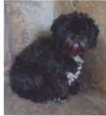
ADOL né en 2005