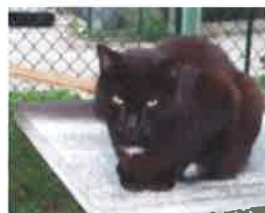
RENAULT 6 ans