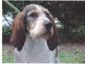
IRWAN né en 2011