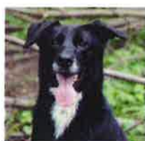
CHOCA né en 2008

Retrouvez-les sur notre site Internet www.spa42.fr