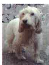
PATI née en 2012