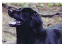
COCA né en 2007