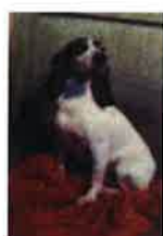
CESAR né en 2007