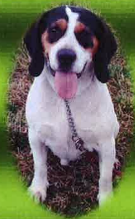
La fabuleuse histoire de KONGO

« Les animaux sont les anges de cette terre »