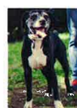
TURBOT né en 2002

ILS SONT EN "PANIER RETRAITE" : trop âgés ou trop malade, ces animaux ne sont plus proposés à l'adoption. Ils sont toujours à la recherche de parrains et marraines afin d'aider à prendre en charge les frais liés aux soins vétérinaires.