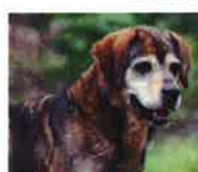
PLUTO né en 2009