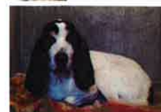
CHAMPION né en 2007