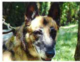
CHANEL née en 2007