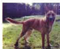
HISBROUK né en 2012