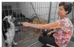
Les bénévoles sont attendus pour adopter un jeune chien.