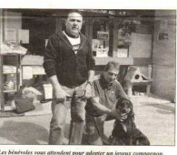
Les bénévoles sont attendus pour adopter un jeune chien.