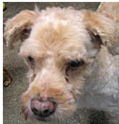
Deux de nos pensionnaires à leur arrivée au refuge