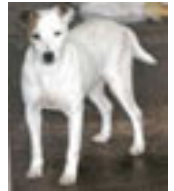
ESQUIMO Adopté à l'âge de 7 ans