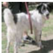
ALADIN Au refuge depuis octobre 2008, il commençait à trouver le temps long lorsque le miracle s'est produit.... Maintenant c'est le bonheur total! Au refuge depuis octobre 2008