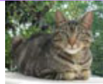
PINNS Au refuge depuis décembre 2009

Au refuge depuis décembre 2009 ANGELE était très craintive et avait besoin de trouver douceur et tendresse pour reprendre confiance. C'est chose faite maintenant.