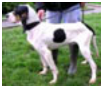
GASTONNI Adopté avec ANGELE Au refuge depuis mai 2010