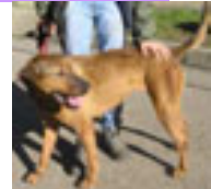
KENYA Au refuge depuis janvier 2010