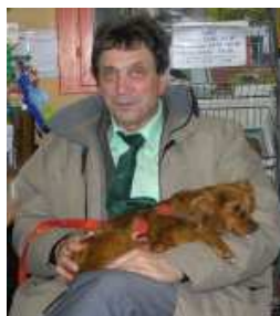
CHRISTIAN (Administrateur) Promène et câline les chiens