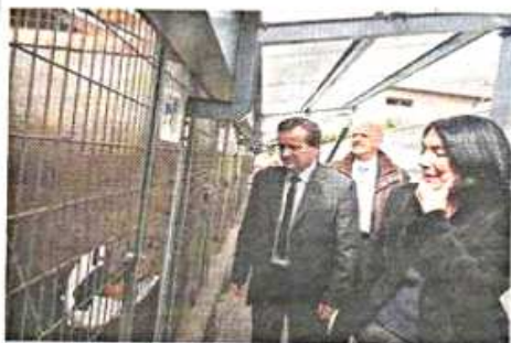
La présidente de la SPA fait visiter les installations du refuge.