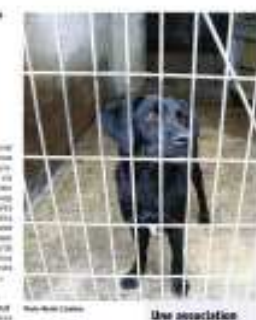
Les associations qui répondent