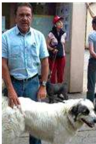
La Tribune le Progrès du 22 août 2012