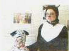
Deux jeunes bénévoles faisaient la communication à l'entrée de la salle.